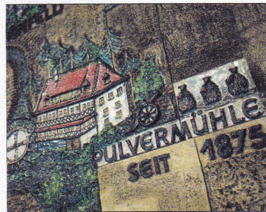
Eine Wandverzierung in der Pulvermühle verweist auf Bestimmung und Alter der Tagungsstätte im oberfränkischen Waischenfeld.